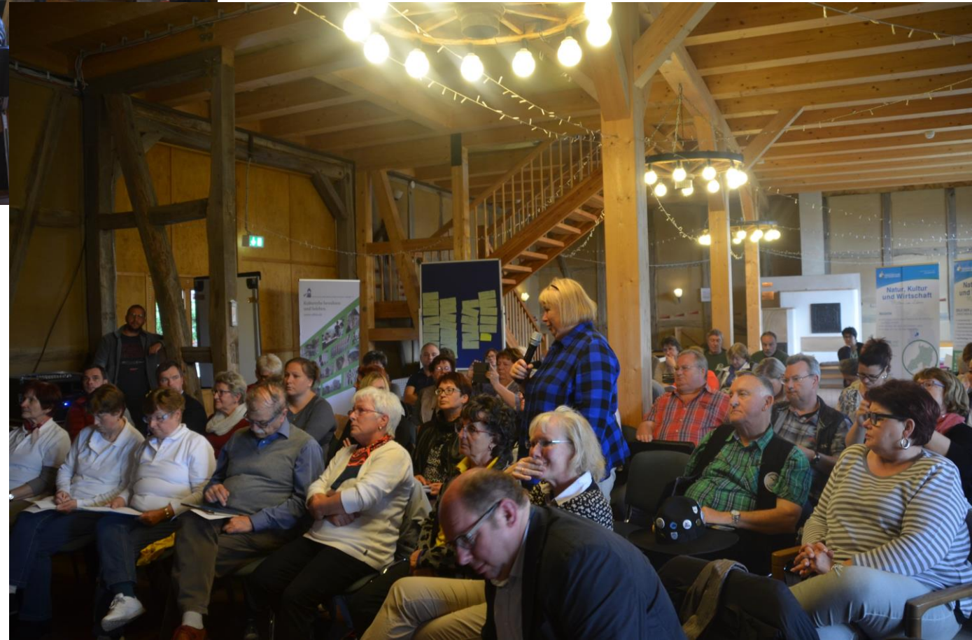
Fachkonferenz LandKULTUR: Projektvorstellung AG 1