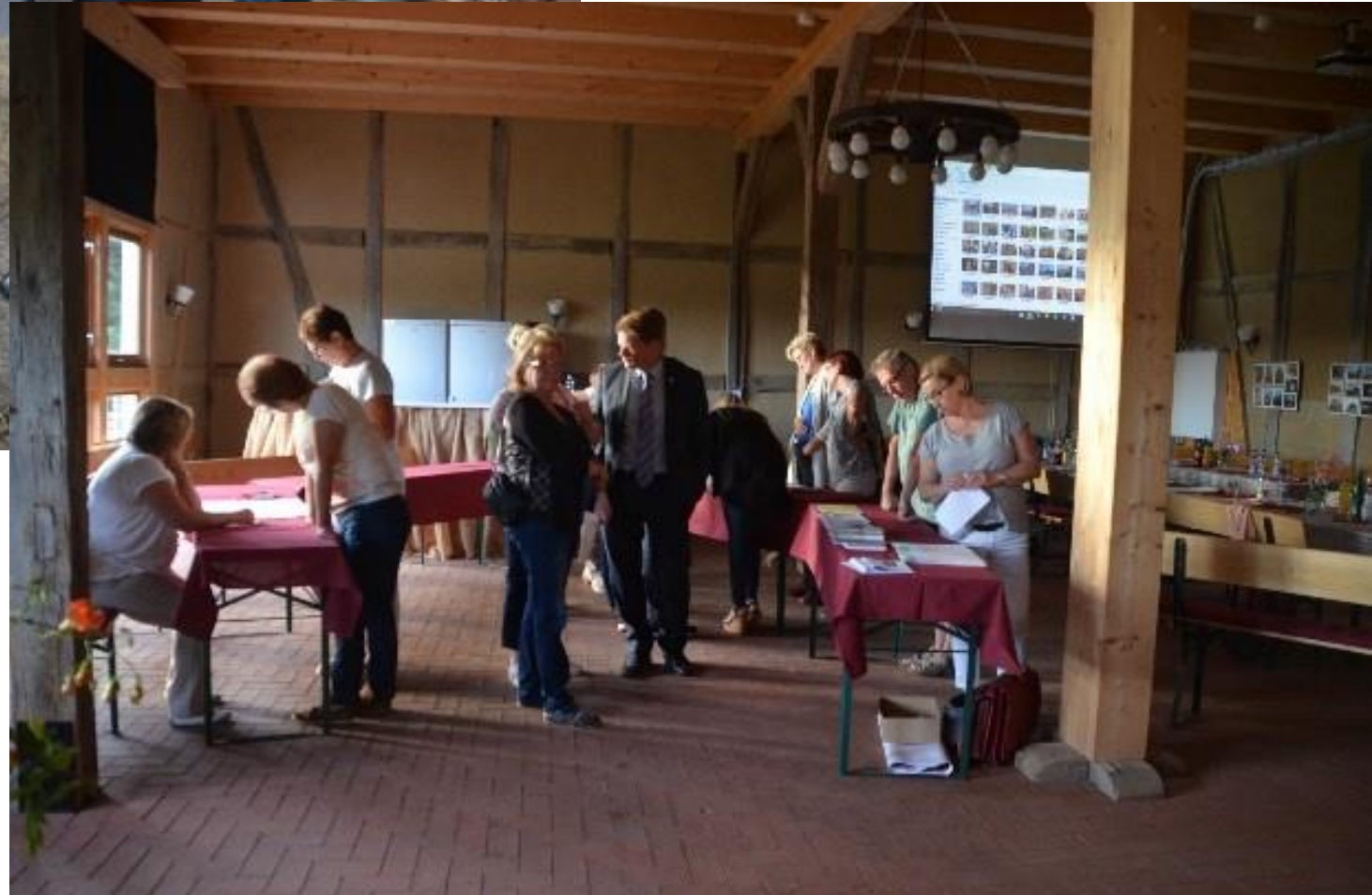
Fachkonferenz LandKULTUR: Projektvorstellung AG 1