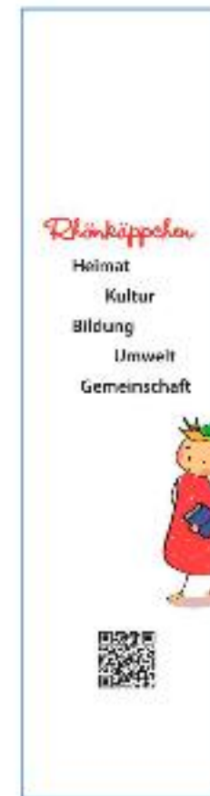
Entwurf der Acrylglasplatten