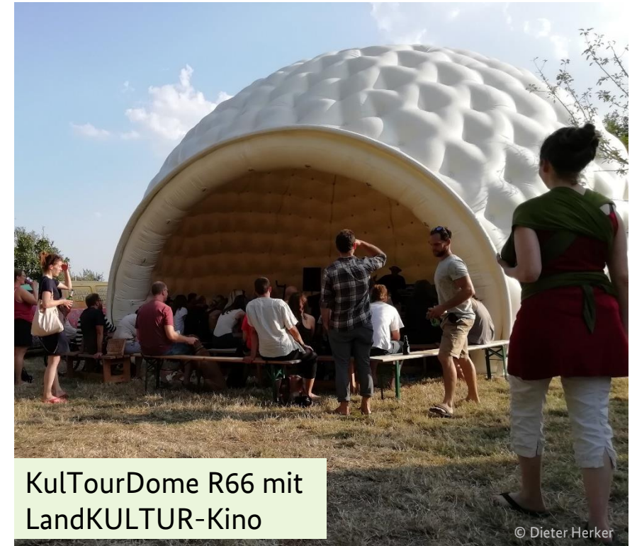
KulTourDome R66 mit LandKULTUR-Kino