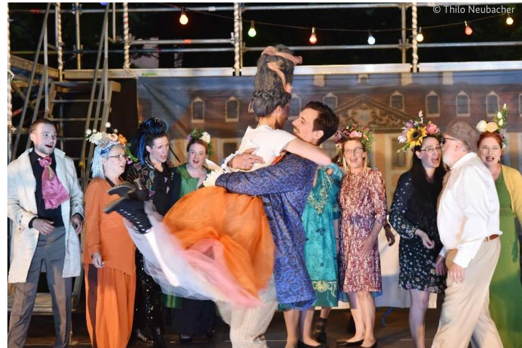
Imeneo | Aufführung der Händel-Oper in barocken Schlössern Thallwitz, Ortsteil Röcknitz, Sachsen