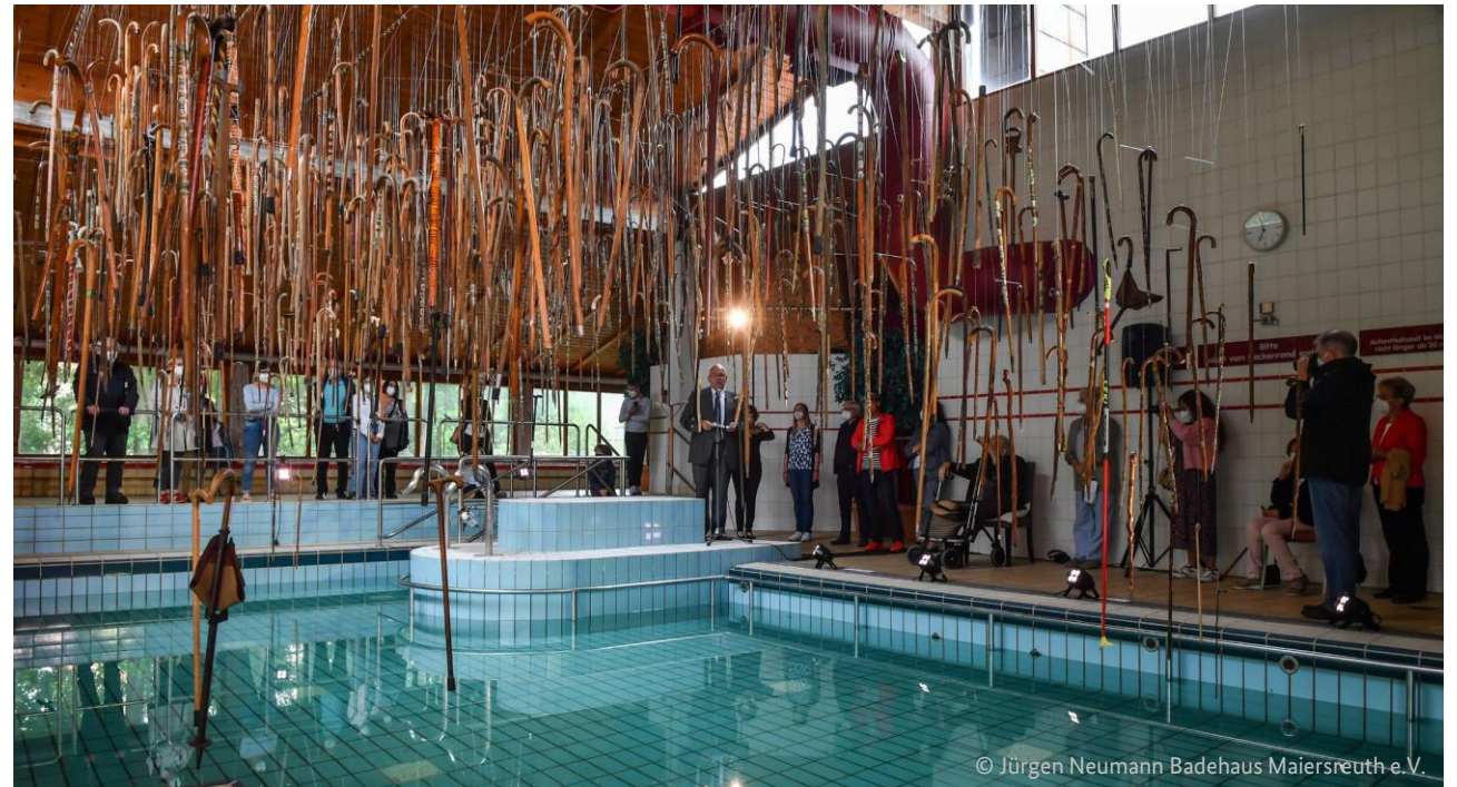
Bad Mai | Umnutzung des ehemaligen Kurmittelhauses Maiersreuth als Kunst- und Kulturzentrum Neualbenreuth, Ortsteil Maiersreuth, Bayern