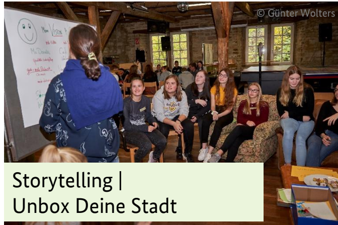
Storytelling | Unbox Deine Stadt